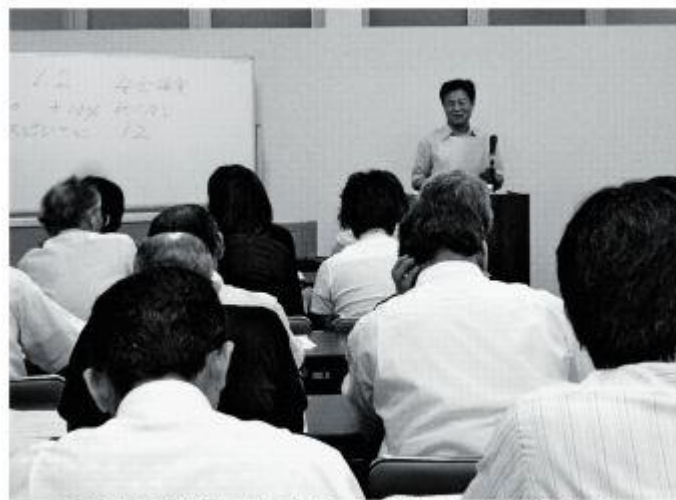
日曜日の午後に行われたマンション投資セミナーには多くの人々が参加し、関心の高さがうかがえた。=7月下旬、埼玉県志木市