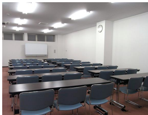
←広いセミナールーム

展覧会・セミナーなど 貸ルームのご案内 東上線志木駅から徒歩3分、元ダイエー志木店前のビル「プラザ鳥山」2階に、レンタルルームがございます。定員12名の会議室3部屋と定員50名のセミナールーム。ホワイトボード、マイク、プロジェクターあり。利用料は時間帯により、例えば午前10時～12時は1時間400円と格安。展覧会や趣味の講座・アコースティックライブなど、お客様のアイデアを生かしてご利用ください。お問い合わせは、(株)ライフデザイン武蔵野 Tel 048-485-5000まで。