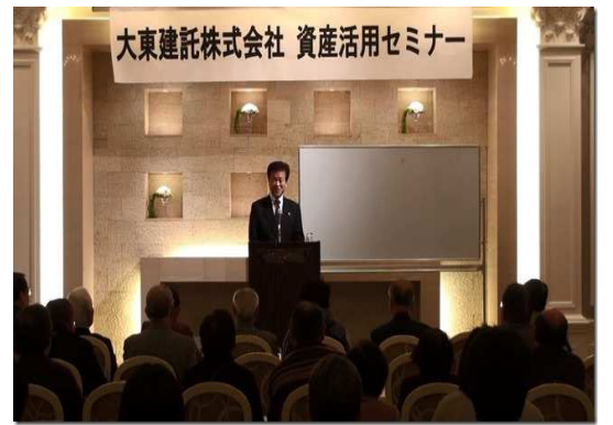
約150名の参加者の前で講演を行う鳥山代表。