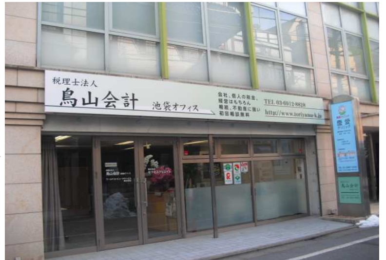
鳥山会計池袋オフィスの外観 (池袋駅より徒歩6分の場所にあります。)