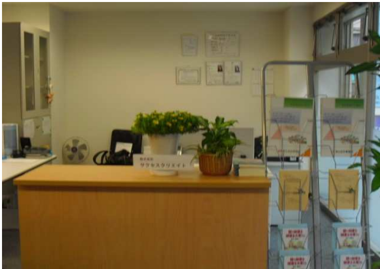
（株）サクセスクリエイトも池袋オフィスにて営業しております。

税理士法人鳥山会計池袋オフィス 住所 東京都豊島区池袋 二丁目六番六号 慶愛鳥山ビル一F 電話 〇三(六九二二)八八二八 FAX 〇三(六九一四)三四二八 電話 〇三(六九一四)三四二七 FAX 〇三(六九一四)三四二八 (株)サクセスクリエイト